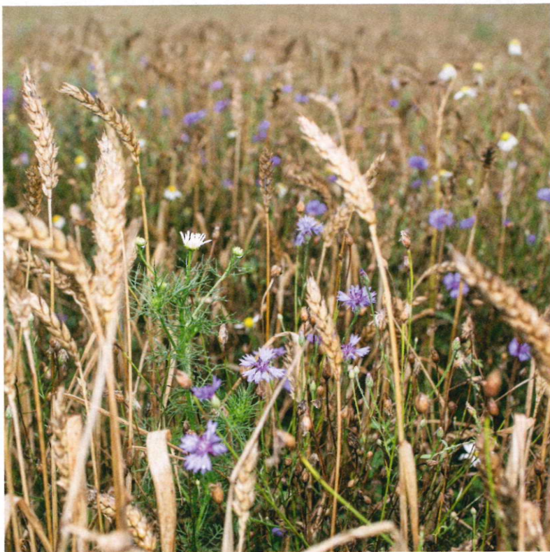
Ökoacker auf Gut Temmen: „Das ist der absolute Traum“