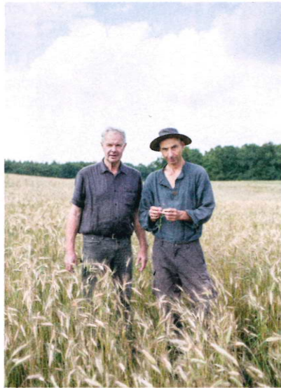
Ökovicisionäre Meyerhoff, Gottwald „Toleranz gegenüber Unkräutern“

Bauernpräsident Joachim Rukwied sorgt sich im SPIEGEL-Streitgespräch um Wett-