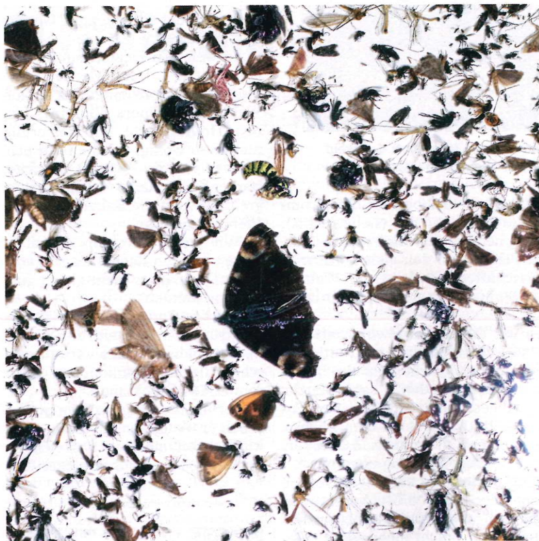
Insektenvielfalt*: Schatztruhe der Entomologie